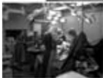
Live operationer og video transmissioner

den medbragte bog kom hjem igen i urørt stand!!