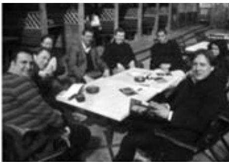
Europæiske alloplastik register, EBRA og forreste adgang til THA

I år var vi 12 læger i alderen 34-43 år fra Tyrkiet, Portugal, Spanien, Italien, England (en indisk uddannet læge), Norge (tysk uddannet), Sverige, Litauen, Slovenien, Slovakiet, Holland og Danmark, en meget broget flok ved første øjekast – men efter få timer skulle det vise sig at vi svingede helt utroligt godt sammen – trods lidt sprogproblemer fra enkelte af kollegaerne fra Italien og Spanien.